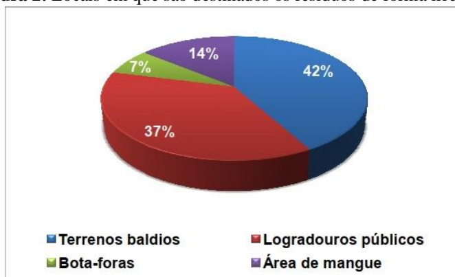
Figura 2: Locais em que são destinados os resíduos de forma irregular

As figuras 2 e 3, apresentadas abaixo, mostram a realidade da forma como são destinados os resíduos, geralmente em local impróprios, a céu aberto, podendo ser vetores de doenças, causando mal estar, uma péssima visibilidade ao ambiente, bem como outros fatores negativos :