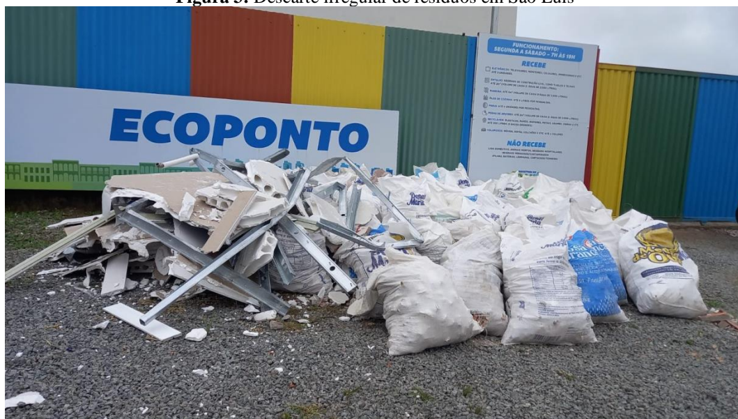
Figura 3: Descarte irregular de resíduos em São Luís