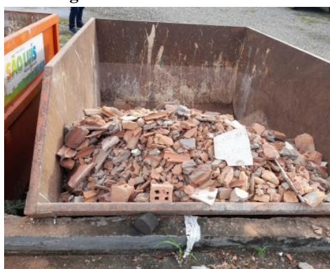
Figura 6: Contêiner com RCC