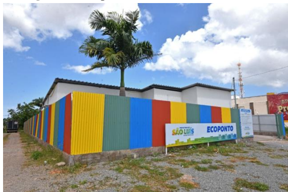
Figura 4: Ecoponto Borborema em São Luís

Para que se possa verificar a praticidade, comodidade e segurança no descarte correto e regular, a figura 4 mostra o padrão dos ecopontos em funcionamento na cidade de São Luís.