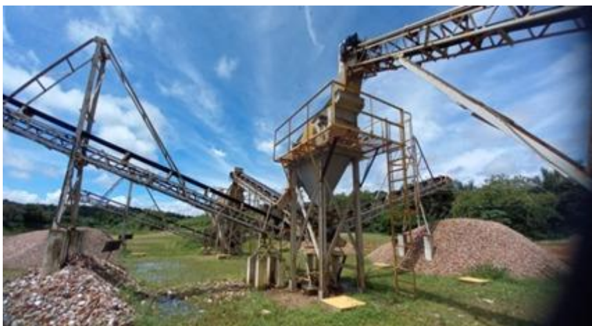
Figura 8: Usina de Britagem de Entulho no CAR em São Luís

A usina de Britagem de entulho (resíduos da construção civil e de demolição) surgiu para mitigar um problema crônico da cidade de São Luis: o descarte irregular de entulho. Só em 2019, aproximadamente 70 mil toneladas de entulho foram mecanicamente removidas das ruas e terrenos da cidade. Com tecnologia 100% nacional, a Usina recebe e tritura o entulho. Como resultado, produz cinco tipos de materiais que podem ser utilizados na pavimentação de ruas, praças e calçadas, trazendo economia para as novas obras públicas (SEMOSP, 2022). Demonstrada na figura 8 abaixo: