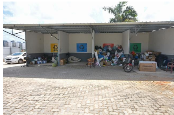
Figura 5: Baias de segregação de Recicláveis