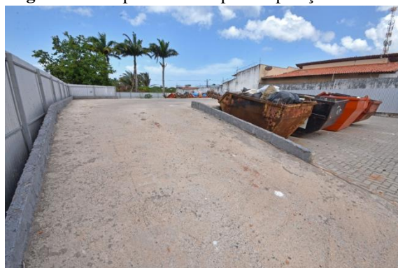
Figura 7: Rampa de acesso para deposição de RCC