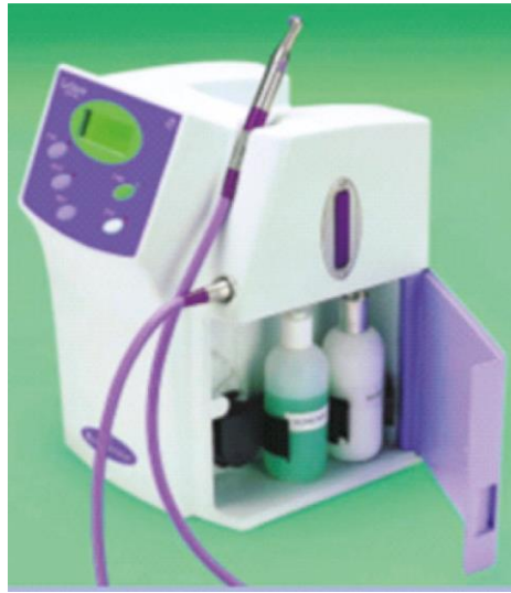
Figura 2 – Gerador de Ozônio Heal Ozone®