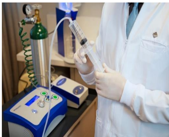
Figura 3 – Aparelho empregue para o manuseio do tratamento da Ozonioterapia odontológica

Já a água ozonizada, é usada como irrigante no conduto radicular, desse modo é alcançada com a movimentação da água bidestilada no gerador de ozônio, em que o gás é sugado pela água, podendo ser utilizado na cavidade oral (MOREIRA et al. ,2021; MOHAMMADI et al. , 2013).