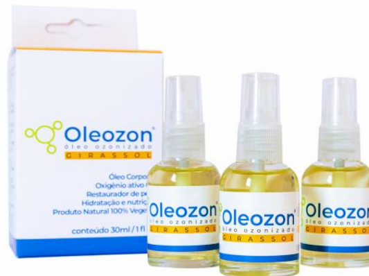
Figura 4– Óleo Ozonizado para tratamentos odontológicos

também o de oliva, de modo que possa ser conservado durante alguns meses. Possui propriedades antimicrobianas, antioxidante, estimula a angiogênese e tem efeito debridante (NIMER et al. ,2018; ROLIM et al. ,2018; SILVA et al. ,2019).