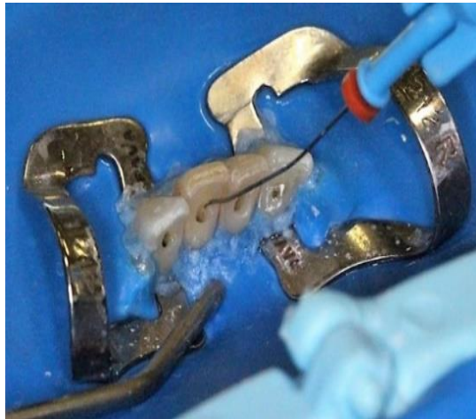
Figura 5 - Irrigação intracanal com água ozonizada na concentração de 40 \mu g /ml

A ação antimicrobiana do ozônio, demonstra-se quando usadas em concentrações e tempo apropriados após os procedimentos tradicionais de preparo do canal, ao potencializar a etapa de limpeza do sistema de canais radiculares demonstrando desse modo a sua eficácia ao combater os agentes patógenos presentes (BOCH et. al , 2016; FERNANDES et. al ,2021).