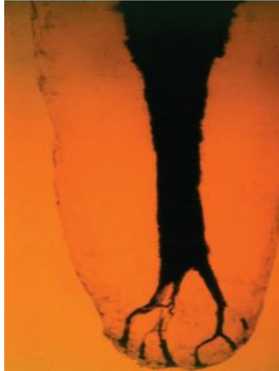
Figura 6 - Pré-molar diafanizado evidenciando a complexidade dos canais na porção apical

patógenos que são eliminados por meio da associação do tratamento convencional associada ao uso do ozônio (CAMPOS et al. , 2018).