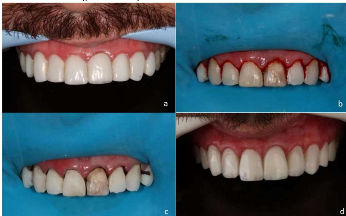
Figura 3 – Evolução da troca de facetas em resina insatisfatórias

Fig a) desarmonia estética e invasão do espaço biológico b) dentes naturais após remoção das facetas. c) tratamento do elemento 21 e aplicação do fio retrator. d) resultado final com facetas adaptadas e correção da cor e anatomia.