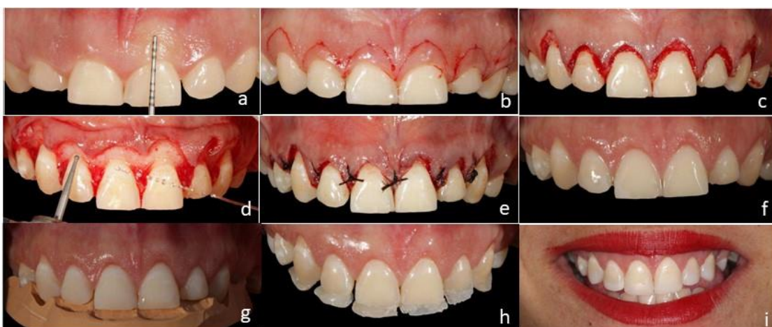
Figura 2 – Demonstração do tratamento conjunto entre periodontia e dentística

Fig. a) marcação da faixa de gengiva a ser removida. b) planejamento do contorno da incisão. c) gengivectomia. d) osteotomia para atingir a distância recomendada. e) sutura e aspecto pós cirúrgico. f) pós-operatório após 21 dias. g) guia para iniciar a confecção das facetas h) conchas palatinas i) facetas diretas em resina após acabamento e polimento.