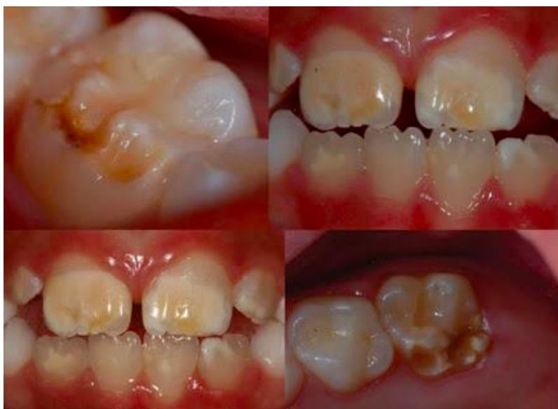
Figura 1 - Aspectos clínicos da HMI