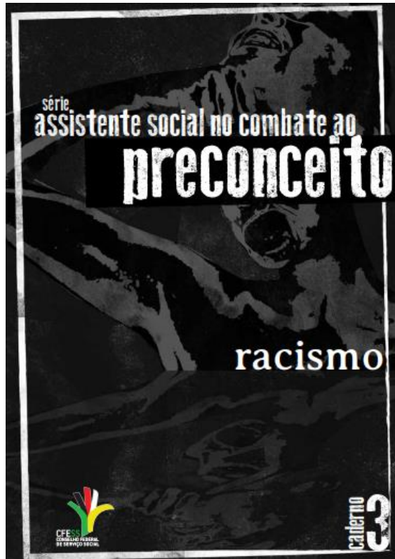
Figura 3 - Campanha "Assistente Social no combate ao preconceito: Racismo"